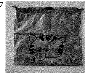
0, 1, 2, 歳児