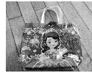
3, 4, 5歳児