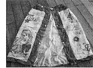
3, 4, 5歳児