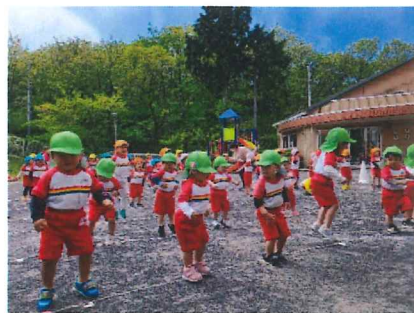
さくらんぼ組 2才児

朝のおやつ、給食、3時のおやつと全員揃って「いただきます」のあいさつが終わるまで食べるものに手を付けず待つことができるようになりました。